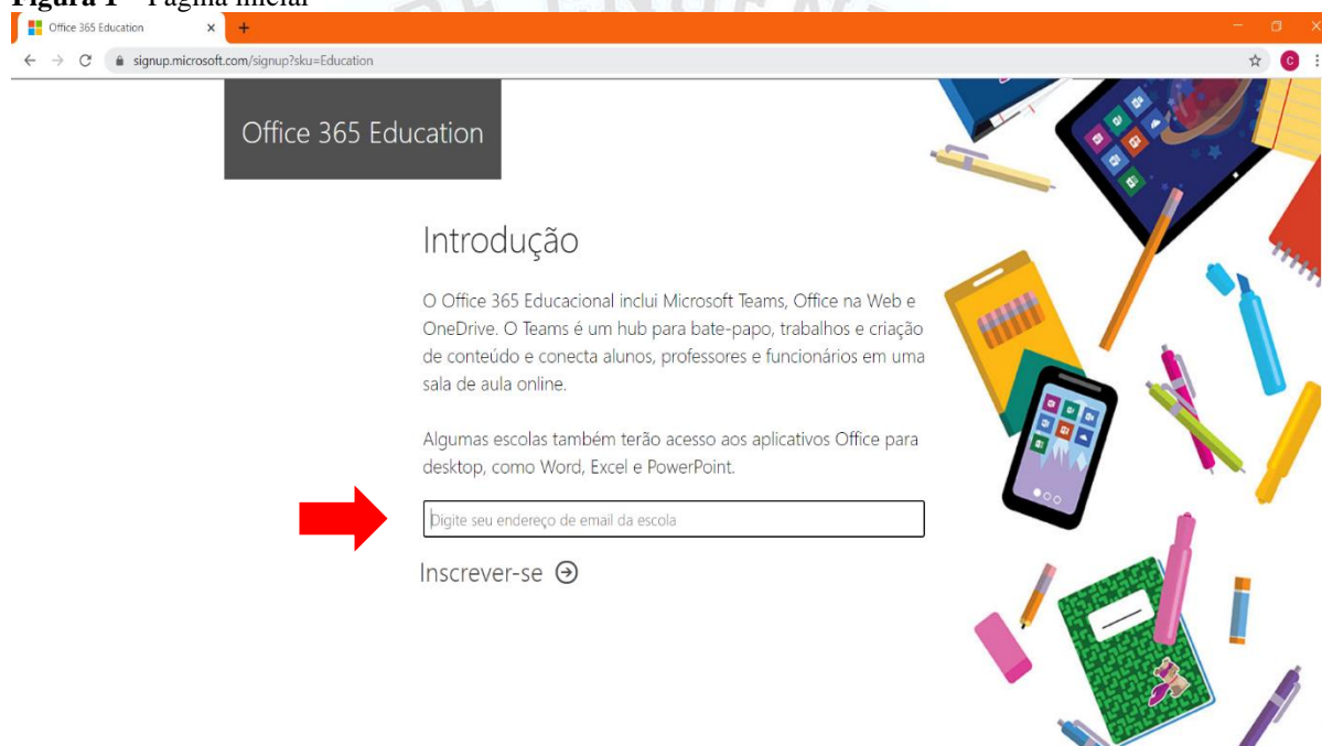
Figura 1 – Página inicial

Insira o seu endereço de e-mail institucional (SeuLoginSigaa@unifesspa.edu.br) no local apontado pela seta vermelha.